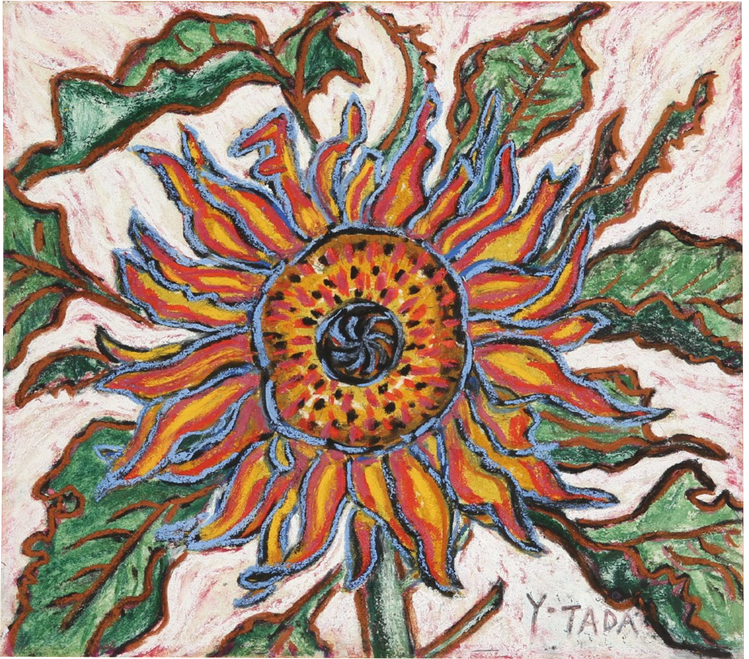
図版/多田裕計 絵画「ひまわり」シリーズ